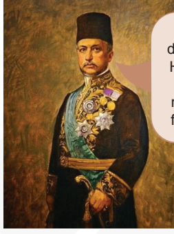
Sait Halim Paşa

Toplumun temel direği dindir. Din ile millet birdir. Hangi milletten olurlarsa olsunlar bütün Müslümanların, halifenin etrafında birleşmesi gerekir.